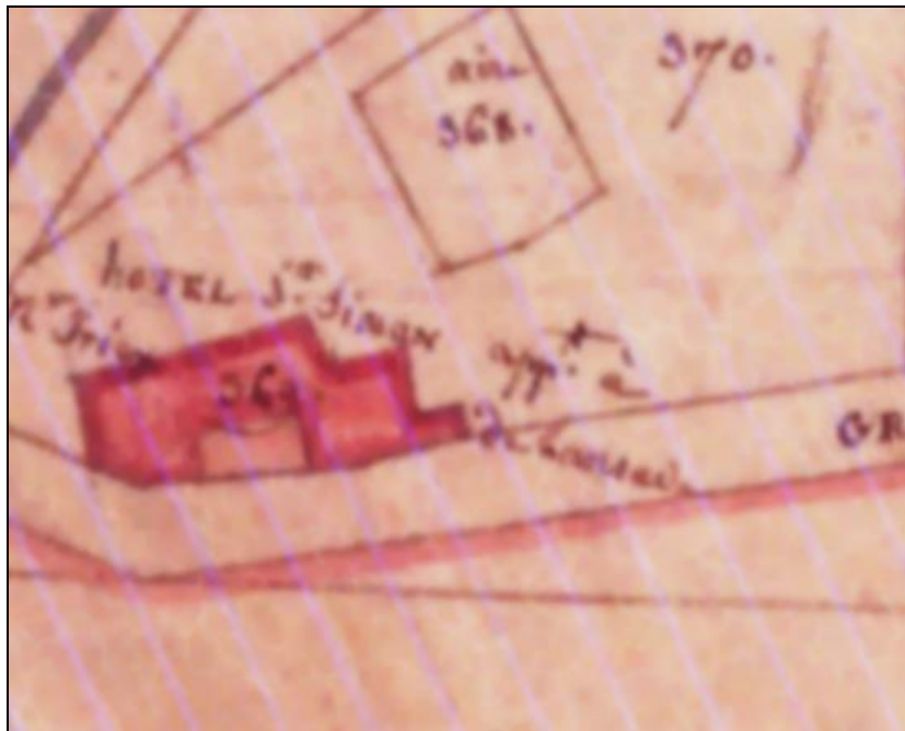
Hôtel St Simon app(t) à Mr Iriex de Lansade, N° 369 cadastre de 1811. Notez que le grand chemin passait au sud de la maison, la route vers St Aunès n'existait pas.